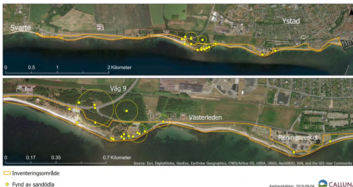
Figur 3. Sammanställning av fynd av sandödlor från genomförd inventering samt nrapporterade fynd från Artportalen (2000-2019). Övre kartan visar en översikt över hela inventeringsområdet. Nedre kartan visar en närmare vy över områdena där fynd av sandödlor gjordes. Större cirklar visar områdena där fler än en sandödlor påträffats.

En privatperson har även rapporterat in ytterligare 35 individer av sandödlor till Artportalen inom och i nära anslutning till inventeringsområdet den 3, 4, 11, 29 juni, 14 juli och 29 augusti 2019. Privatpersonens observationer har rapporterats i området kring fyndet 2011. Artportalens fynd anger att även yngre djur observerats, både tre större ungar från 2018 som observerades i början av juni och 16 mindre årsungar från 2019 som observerades i augusti. Sammanlagt anges i Artportalen att 13 honor, varav tre ungar från 2018, har observerats under 2019. En sammanställning av alla observationer visas i figur 3.