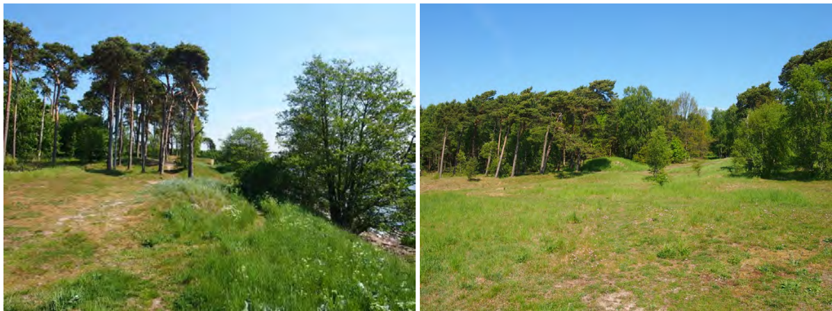
Figur 4. Lämplig miljö för sandödlor. Bilderna är tagna i området där flest observationer av sandödlor gjordes. Den högra bilden visar den föreslagna utsträckningen där markkabinerna ska mynna ut i havet.

Största delen av kuststräckan mellan Ystad och Svarte är mer eller mindre likformig med heltäckande grässvål utan ris, småbuskar och sandblottor. Undantagen finns på de platser där fynd av sandödlor gjorts (fig. 3). Här är miljön mer varierande med mosaikartad markvegetation av partier med högre och lägre örtvegetation, glesa tallskogspartier, sandblottor, mindre buskar, stenar, inslag av död ved samt sandiga slanter ner mot havet (fig. 4). Här finns goda möjligheter för sandödlor att söka skydd, föda och solningsplatser, fortplanta sig och övervintra. I området där flest fynd gjorts (fig. 3) observerades ett flertal hålor som sandödlorna sågs nyttja till skydd (fig. 5). Det finns långa delar av stranden mellan Ystad och Svarte troligen skulle kunna passa sandödlor, men det verkar vara alltför heltäckande grässvål för att vara optimalt.