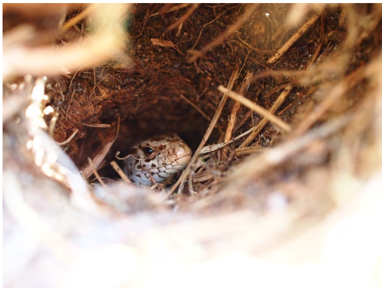
Figur 5. Hona av sandödlor tar skydd i markhåla.