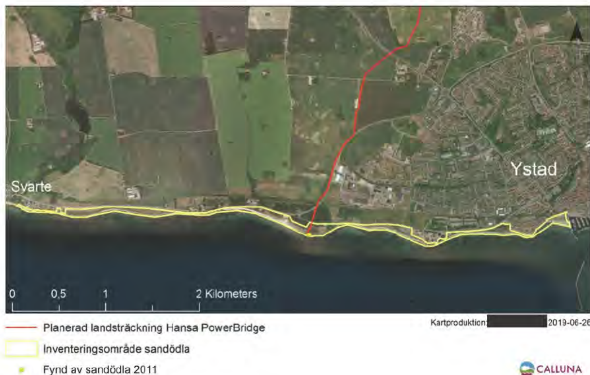
Figur 2. Översiktskarta över inventeringsområdet.

Den metod som användes vid inventeringen är den som finns fastställd för nationell övervakning av sandödlor (Hallengren 2010). Metoden innebär att man går och systematiskt söker efter djur i lämpliga miljöer. När prassel hörs i vegetationen stannar man upp och väntar tills man eventuellt ser djuret. Man lyfter även på stenar, stockar och liknande som kan utgöra gömställen eller solplatser för sandödlor. Tidpunkten för inventering är som mest optimal i maj och augusti för vuxna individer. Ungdjur inventeras i augusti och september. Denna inventering har fokuserat på vuxna djur och inventering har därför skett i april, maj och juni. Även om april och juni inte anses vara den mest optimala tiden för inventering av sandödlor går det att hitta individer varma och soliga dagar. Varje lokal ska genomsökas i minst 45 minuter beroende på storlek och lämplighet för sandödlor och en lämplig lokal kan kräva upp till tre besök. Vädret måste vara soligt men inte alltför varmt (<30°C i skuggan). Optimalt är att inventera vid soligt väder precis efter att det varit mulet och kallt eftersom sandödlorna då är lätta att upptäcka när de snabbt kommer fram för att utnyttja solen för att värma sig. Antalet observerade individer av sandödlor noteras och räknas.