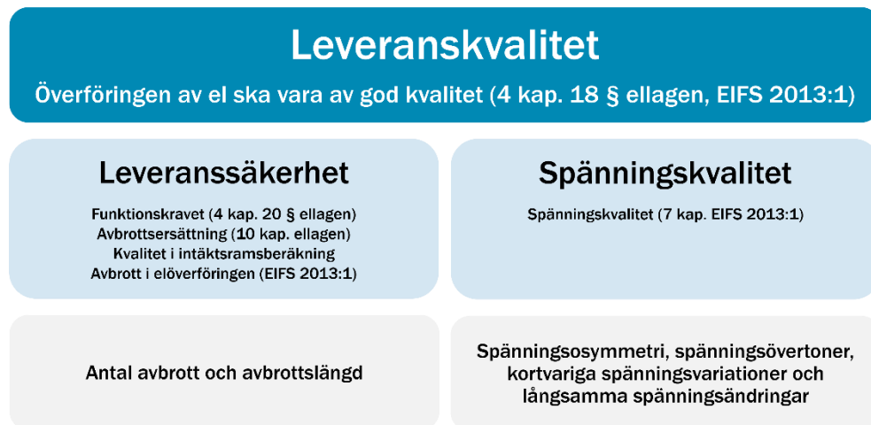
Figur 1 Begreppet leveranskvalitet