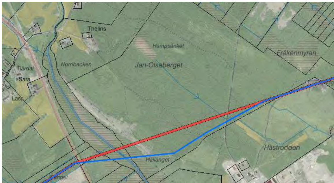
Bild 1. Justering av ledningssträckning över fastighet Rutvik 5:9. Den nya sträckningen är enligt det blå strecket och den ursprungliga återges i rött.

Sökanden har emottagit en önskan av markägaren, Luleå kommun, för fastighet Rutvik 5:9 att utföra en justering av ledningssträckan enligt bild 1. Anledningen till justeringen är att markägaren önskar ett mindre intrång på sin fastighet. Ledningsdragningen kommer fortsatt att vara på markägarens fastighet [REDACTED] men kommer att ligga närmare fastighetsgränsen än tidigare förslag.