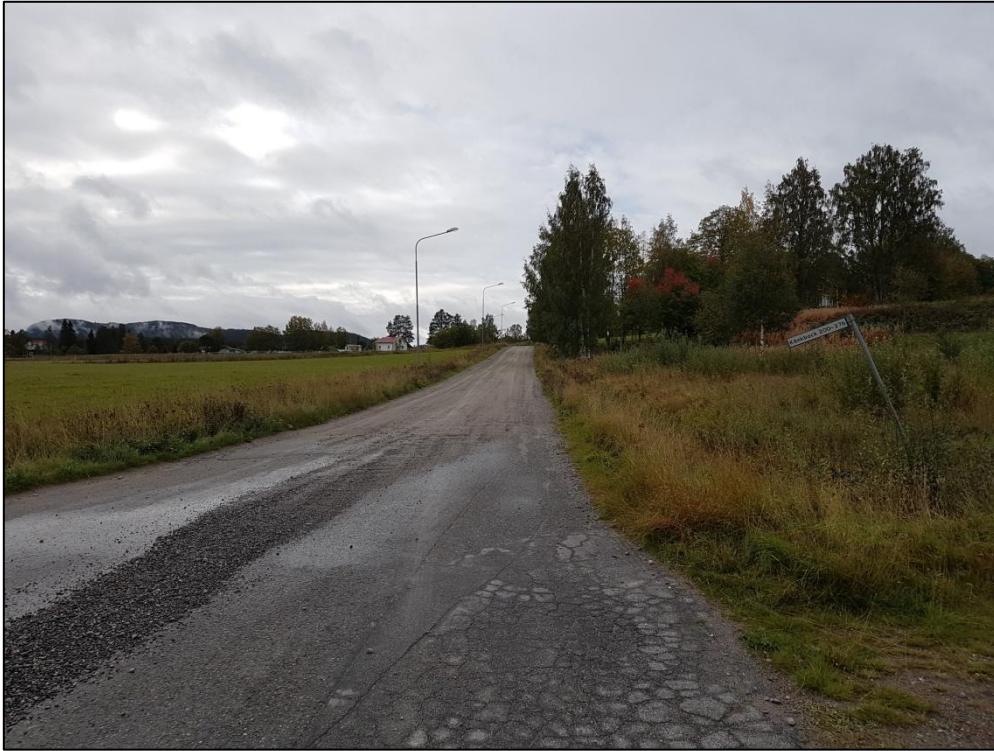
Figur 1. Undersökningsområdets norra del, vy mot SSV från korsningen Idrottsvägen–Ljungvägen.