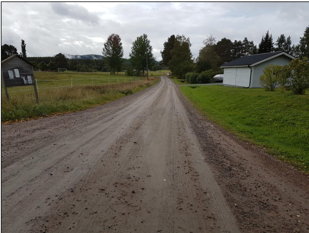
Figur 2. Undersökningsområdets sydligaste del, vy mot NNÖ från Kånkback.