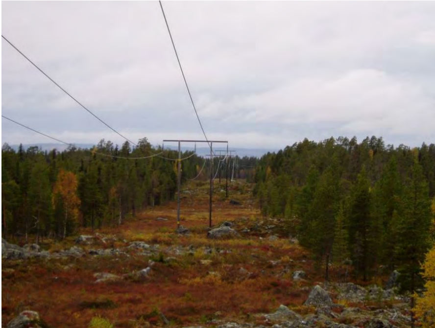
Figur 2. 130 kV luftledning i regionnätet, trädsäker.

med en trädsäker luftledning i en cirka 40 meter bred skogsgata. Eftersom markförläggning av befintliga luftledningar pågår i stor omfattning för lokalnätsledningar, med lägre spänningsnivå, är det fullt förståeligt att det finns en uppfattning att markförläggning av större regionnätsledningar kan ske i samma omfattning. Så är inte fallet utan de tekniska utmaningarna med markförläggning av kraftledningar ökar med stigande spänningsnivå.