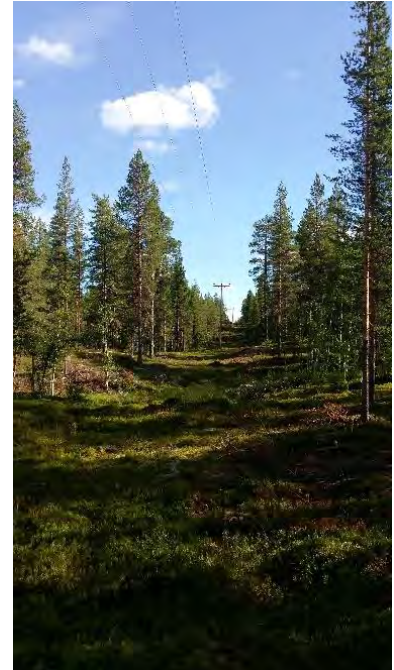
Figur 3. 20 kV luftledning i lokalnätet, ej trädsäker.