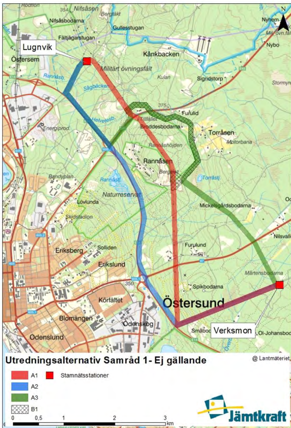
Figur 2 Ej gällande. Alternativa strååk som utreddes i samråd 1.

I samrådet framkom det att Försvarsmakten har stora intressen i det aktuella området och de delar av utredningskorridor A1 samt A3 som berörde Försvarets militära övningsfält förkastades. utredningskorridor genom Försvarets militära övningsfält förkastades. Tillsammans med övriga synpunkter har detta lett fram till en föreslagen ledningssträckning samt stationsplaceringen i Östersem (Se Figur 4).