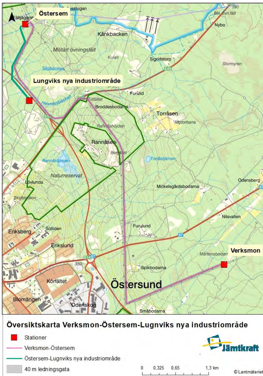
Figur 4 Karta över ledningssträckor för Verksmon-Östersem-Lungviks nya industriområde