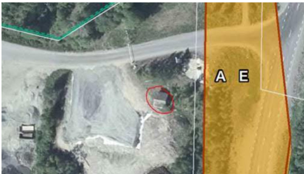
Figur 2. Placering av förrådsbyggnader.

Fastighetsägaren informerar om att de till följd av den planerade industrin norr om deras verksamhet, kommer få en ny infart. De kommer önska av kommunen att infartsvägen hamnar på fastighet [REDACTED] (vid bommen) norr om diket.