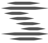
Tabell 1. Samlad konsekvensbedömning för samtliga utbyggnadsförslag under driftfas.