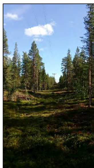
Figur 2. Foto över trädsäker 130 kV luftledning i regionnätet till vänster samt ej trädsäker 20 kV luftledning i lokalnätet till höger.